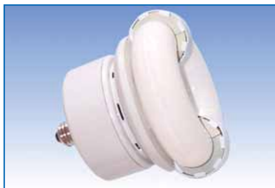
▲ Lampada a ballast incorporato

prodotto. Eventuali sperimentazioni, per di più fatte con i soldi pubblici, presterebbero il fianco a contumelie di carattere prettamente politico, con inevitabili ricadute sui vertici delle aziende e sui loro "sponsor";